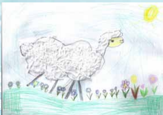
Rys. Nikola Zymelke, lat 6, SP nr 1 w Rzeszowie

* W naszym ogródeczku. Antologia poezji dziecięcej, Białystok 2010, s. 36.