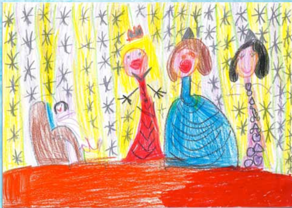
Rys. Karolina Kapińska, lat 6, SP nr 1 w Rzeszowie

W taki wieczór najlepiej wtulić się w miękką poduszkę i słuchać o tym, jak Księżę poślubił biednego Kopciuszka.